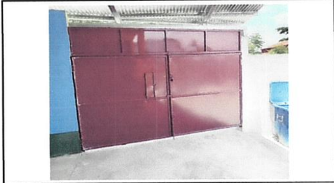
SE REALIZÓ MANTENIMIENTO A PORTON DE METAL