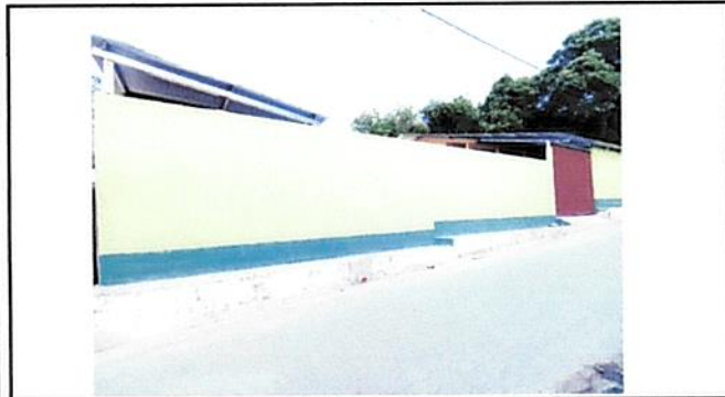
SE REALIZÓ REPARACIÓN DE MURO PERIMETRAL