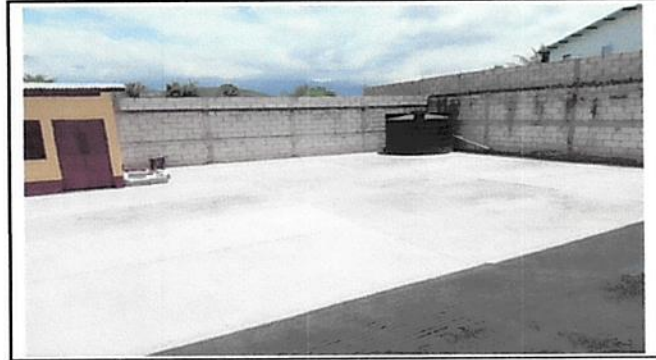
SE REALIZÓ LOSA DE PATIO