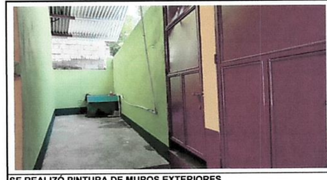
SE REALIZÓ PINTURA DE MUROS EXTERIORES

Observación: Si es necesario se pueden agregar hojas adicionales y actualizar el número de hojas.