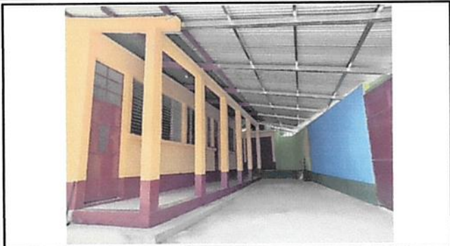
SE REALIZÓ PINTURA DE MUROS Y EXTERIORES, SUSTITUCIÓN DE LAMINA TROQUELADA